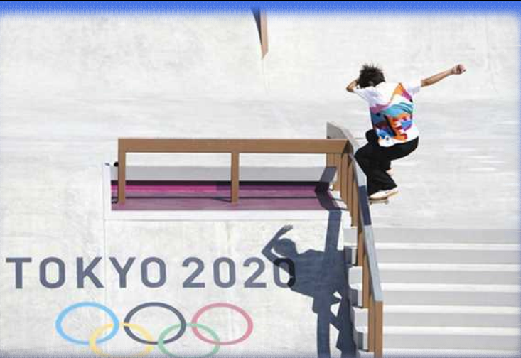
予選を通過した堀米雄斗の演技

現在のプロスケーターの一人です。彼は多くの世界大会で優勝し、スケートボードを乗るスタイルの格好良さや上手なトリックをすることで知られています。若い世代のスケーターたちにとって大きな影響力があり、彼のトリックを見て、スタイルを真似する人が多くいます。彼は、日本で2020年に行われた東京オリンピックでスケートボードの金メダルを獲得し、日本中の人々を感動させました。