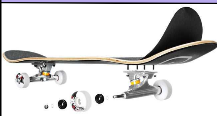
現代のスケートボード