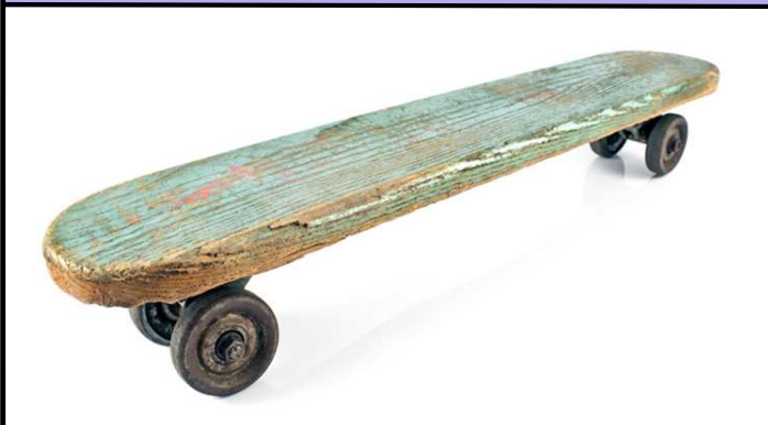
昔のスケートボード