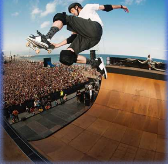
(引用元 : Tony Hawk, Accessed 24 Mar 2023, https://www.newsweek.com/tony-hawk-interview-50-skateboarding-legend-talks-career-fame-simpsons-915750 )