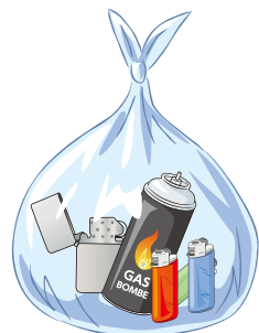
③ ライター、 ガス缶、 スプレー缶